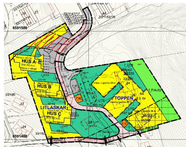
Fig. 1 «FØR» Dagens gjeldende regulering Litlaskar. Fig. 2 «ETTER» Litlaskar og Toppen, nå til behandling.